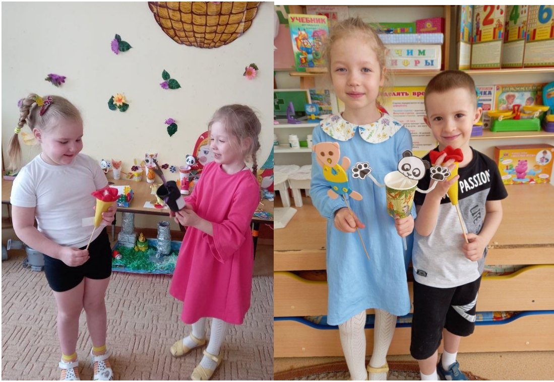
Аппликация «Дружные ребята»