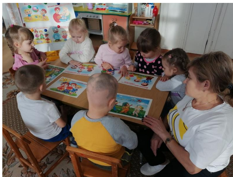
Игры с игрушками-мирилками