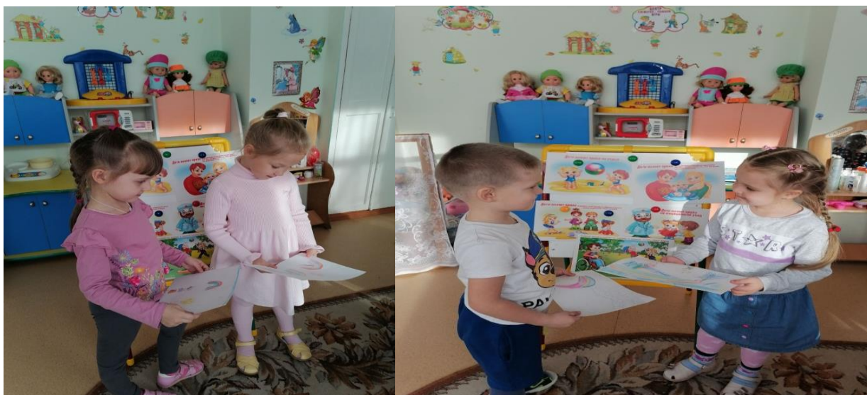
Беседа «Что такое дружба?»