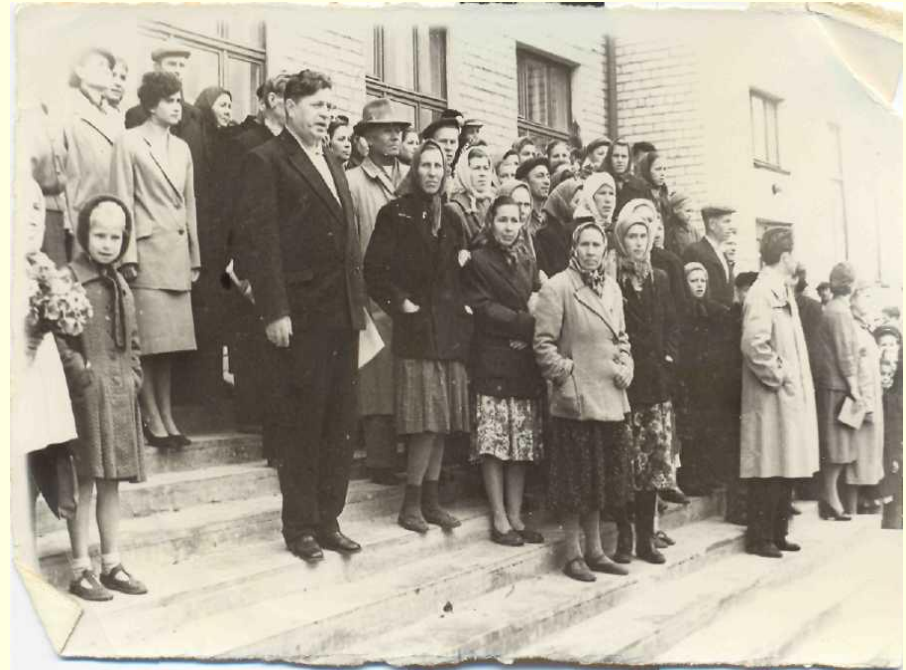
Первое сентября в новой школе