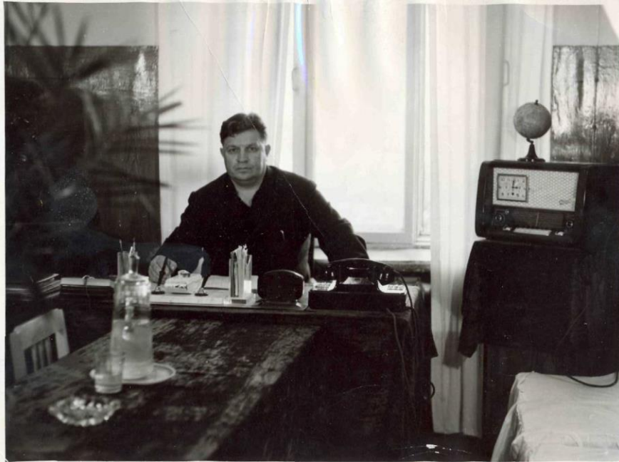
Директор школы №21