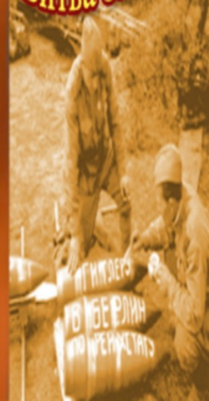
Битва за Берлин