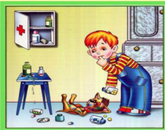
Не трогай таблетки