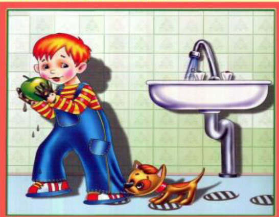
Мойте руки перед едой