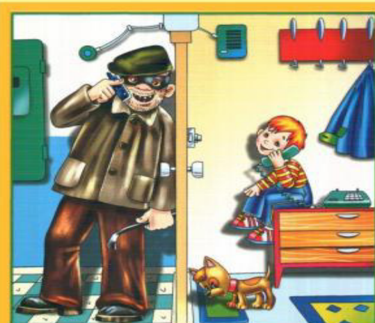
Не разговаривай и не открывай дверь незнакомым людям