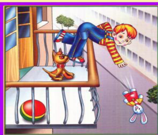
Не играй на балконе, упадешь